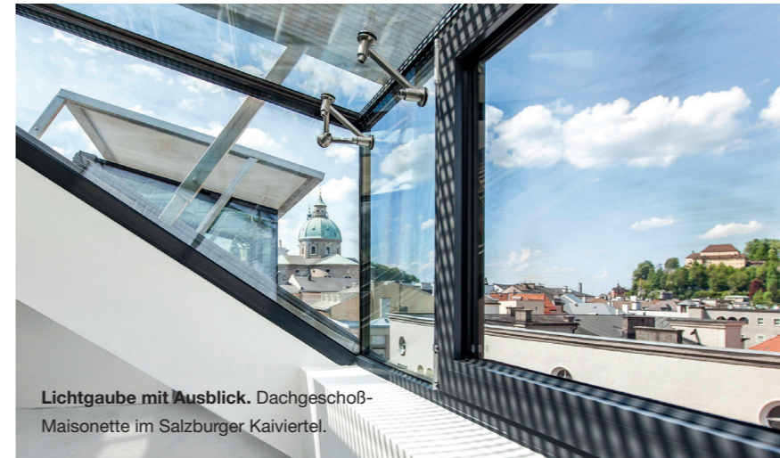
Lichtgaube mit Ausblick. Dachgeschoß-Maisonette im Salzburger Kaiviertel.