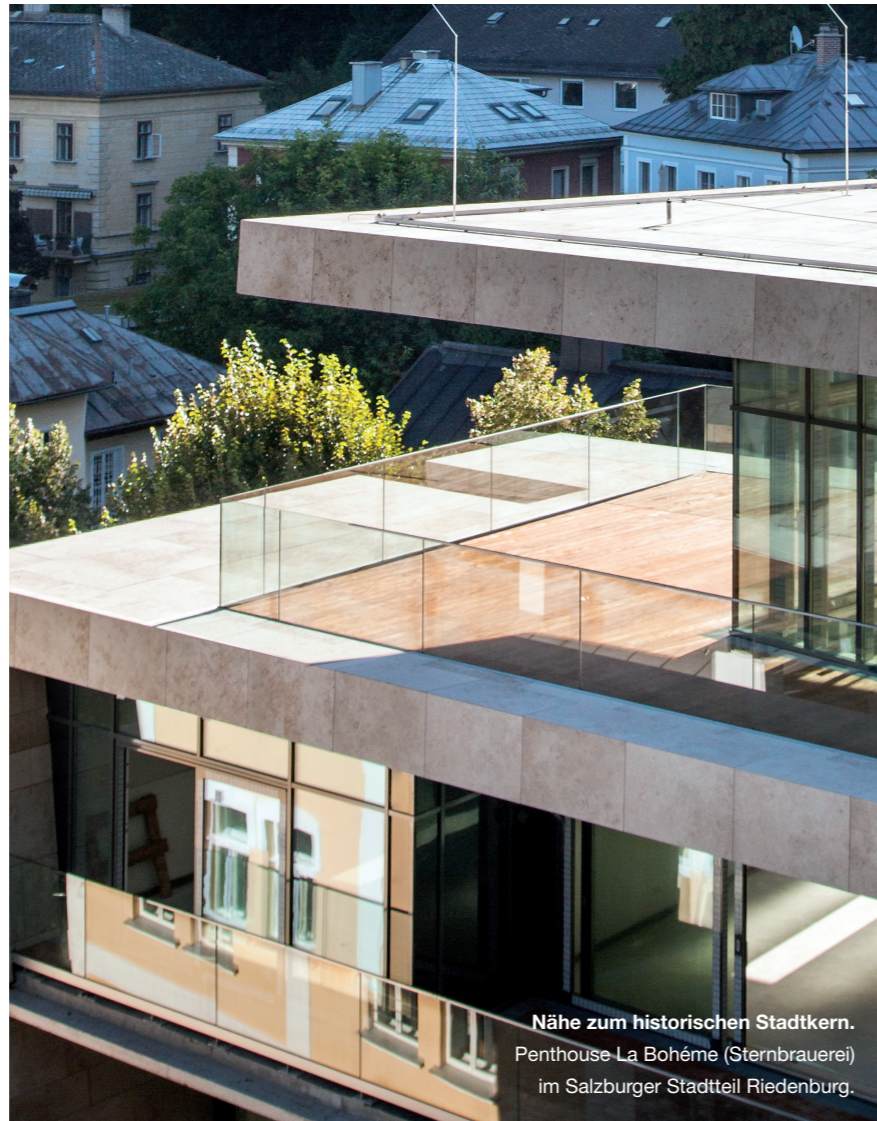
Nähe zum historischen Stadtkern. Penthouse La Bohème (Sternbrauerei) im Salzburger Stadtteil Riedenburg.

Schonsnovski bemängelt aber auch die Leistung, die man für stolze Preise an den Mann bringen möchte: „In Salzburg ist die Dichte an Luxusimmobilien natürlich nicht so groß wie in einer Großstadt, dementsprechend schwierig ist es, etwas zu finden. Und die Klientel, die wirklich Luxus sucht, hat auch Luxusansprüche, das heißt, im High-End-Bereich. Dementsprechend müssen auch die Ausstattung und die Lage sein, mit Aufzug direkt in die Wohnung, mindestens zwei Tiefgaragenstellplätzen und dergleichen mehr. Und das ist in Salzburg schwer. Es werden zwar hohe Preise verlangt, aber die Leistung ist im Moment nicht oder nur selten entsprechend.“ Am leichtesten zu verkaufen seien die klassischen Anlegerwohnungen bis 350.000 Euro, aber auch bis zu 750.000 Euro bewege sich noch viel. „Wenn die Liegenschaft gut eingepreist ist, gibt es eine starke Nachfrage und auch ein gutes Angebot“, so Schonsnovski. „Wer zwischen 200.000 und 500.000 etwas sucht, findet regelmäßig etwas, auch Neubauprojekte. Weil dieser Markt auch relativ transparent ist.“ Anders bei Häusern: Hier gebe es kaum Neubau beziehungsweise die Häuser hätten alle ein gewisses Alter und sehr hohe Preise. Und bei allem, was über 750.000 Euro hinausgehe, sei es sehr zäh