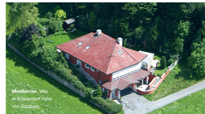
Mediterran. Villa in Köstendorf nahe von Salzburg.