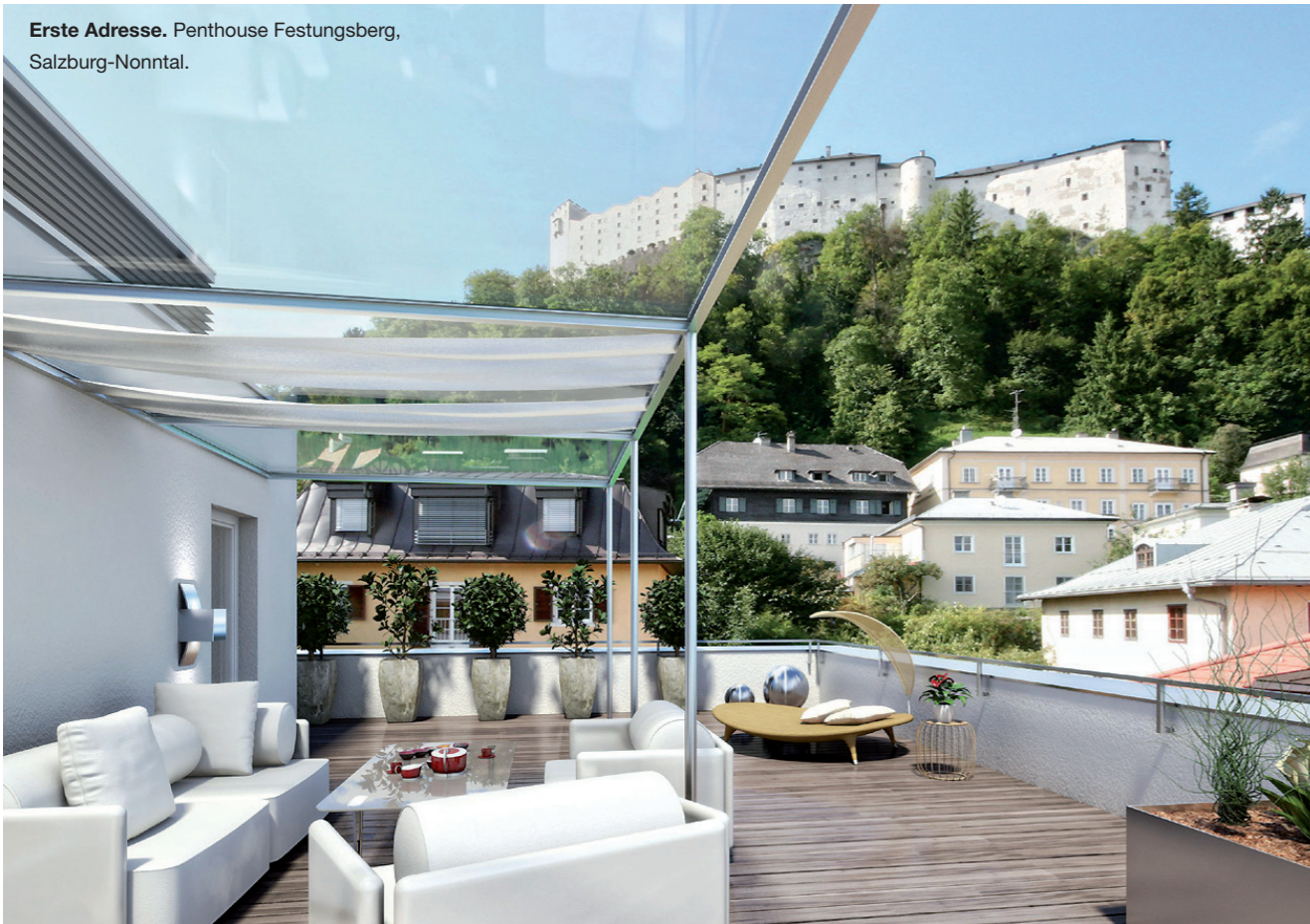
Erste Adresse. Penthouse Festungsberg, Salzburg-Nonntal.