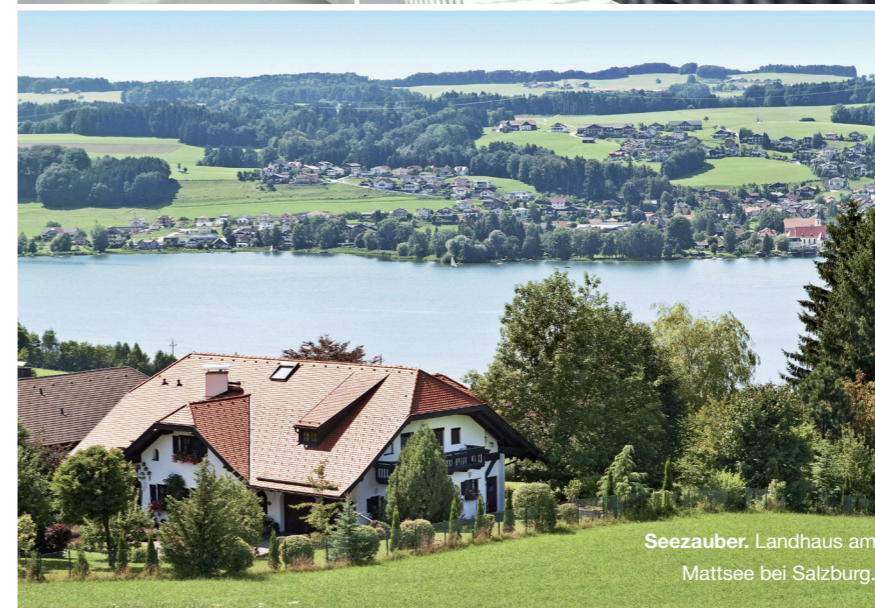
Seezauber. Landhaus am Mattsee bei Salzburg.

denen Regionen Deutschlands nun viel besser seien als in den letzten Jahren, spüren man, dass auch die Tendenz der Deutschen, hier Immobilien zu kaufen, wesentlich gestiegen sei – auch was Ferienimmobilien betreffe, zum Beispiel zum Skifahren am Wochenende. „Es übersiedeln auch einige mit der Familie hierher, weil sie die Lebensqualität hier in Österreich suchen. Wir haben inzwischen auch internationale Schulen hier, nicht nur die International School St. Gilgen, sondern auch – worum ich sehr lange gekämpft habe – eine internationale Volksschulklasse, die englischsprachig geführt wird“, so Muhr. Auch diese positive Entwicklung trage dazu bei, dass immer mehr zuzögen, um