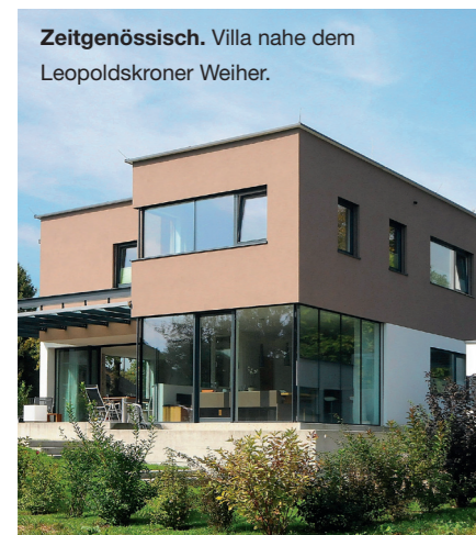
Zeitgenössisch. Villa nahe dem Leopoldskroner Weiher.

haben, vor allem aus Deutschland, aber auch von Leuten aus anderen Ländern, welche die hiesige Lebensqualität besonders schätzen.“ Nachdem die Flugverbindungen zwischen Salzburg und verschie-